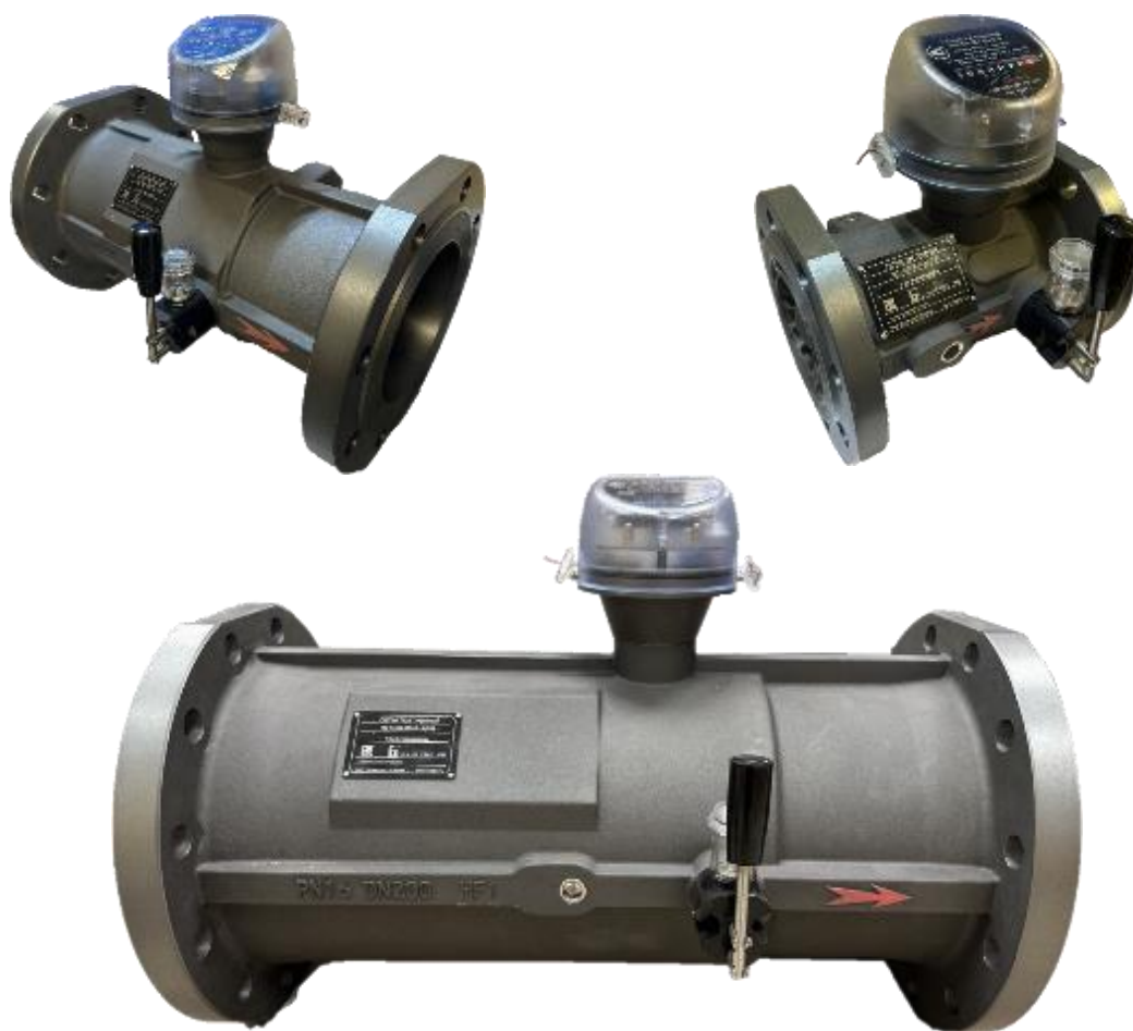
Рисунок 1 – Общий вид основных исполнений счетчиков